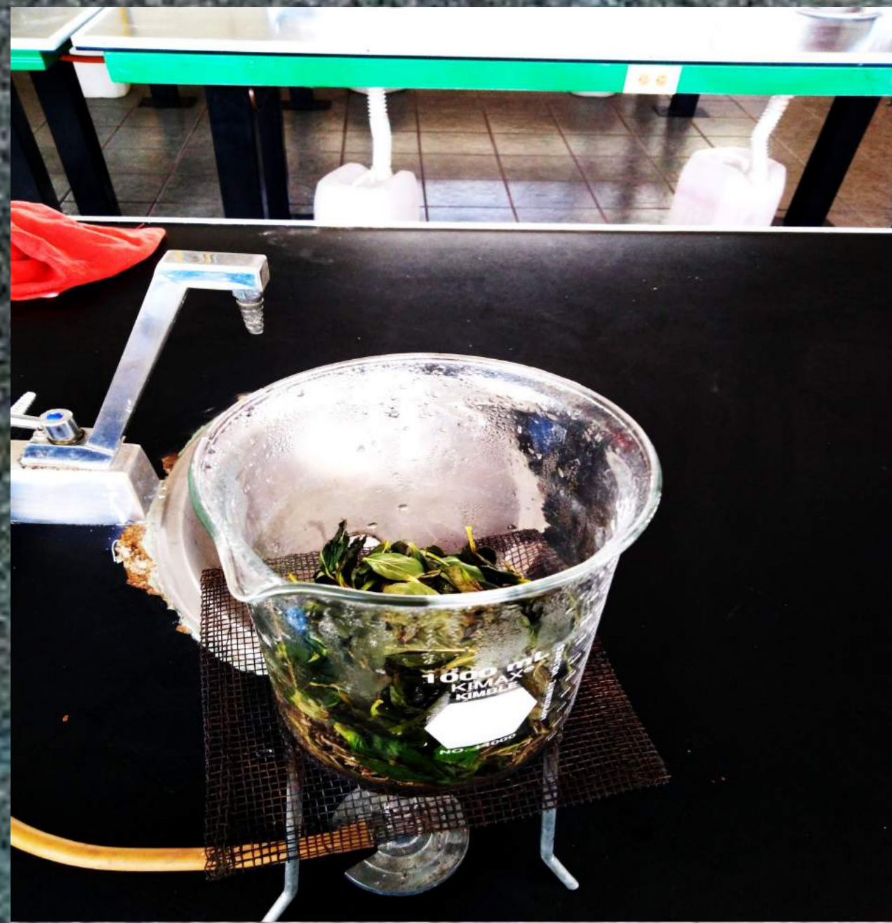
Fig.1: Infusion de hiervas