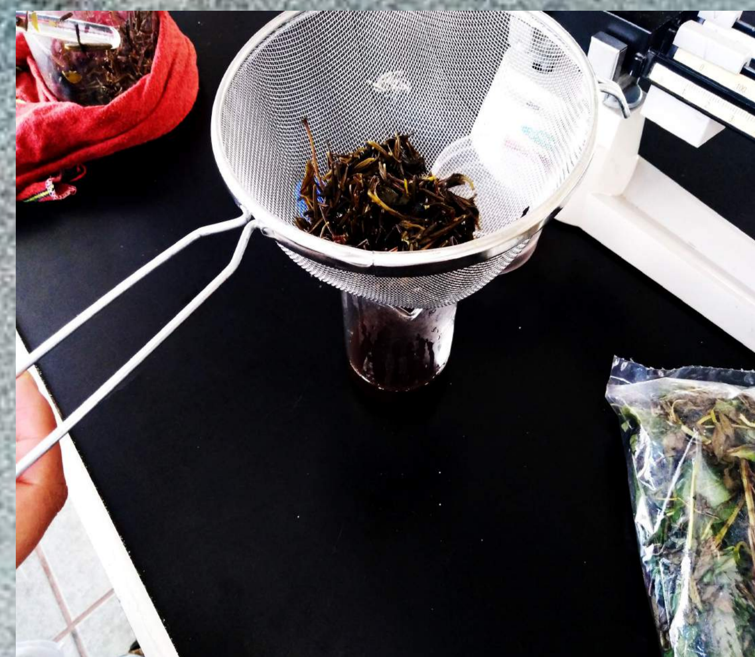
Fig.2: Colando la mezcla