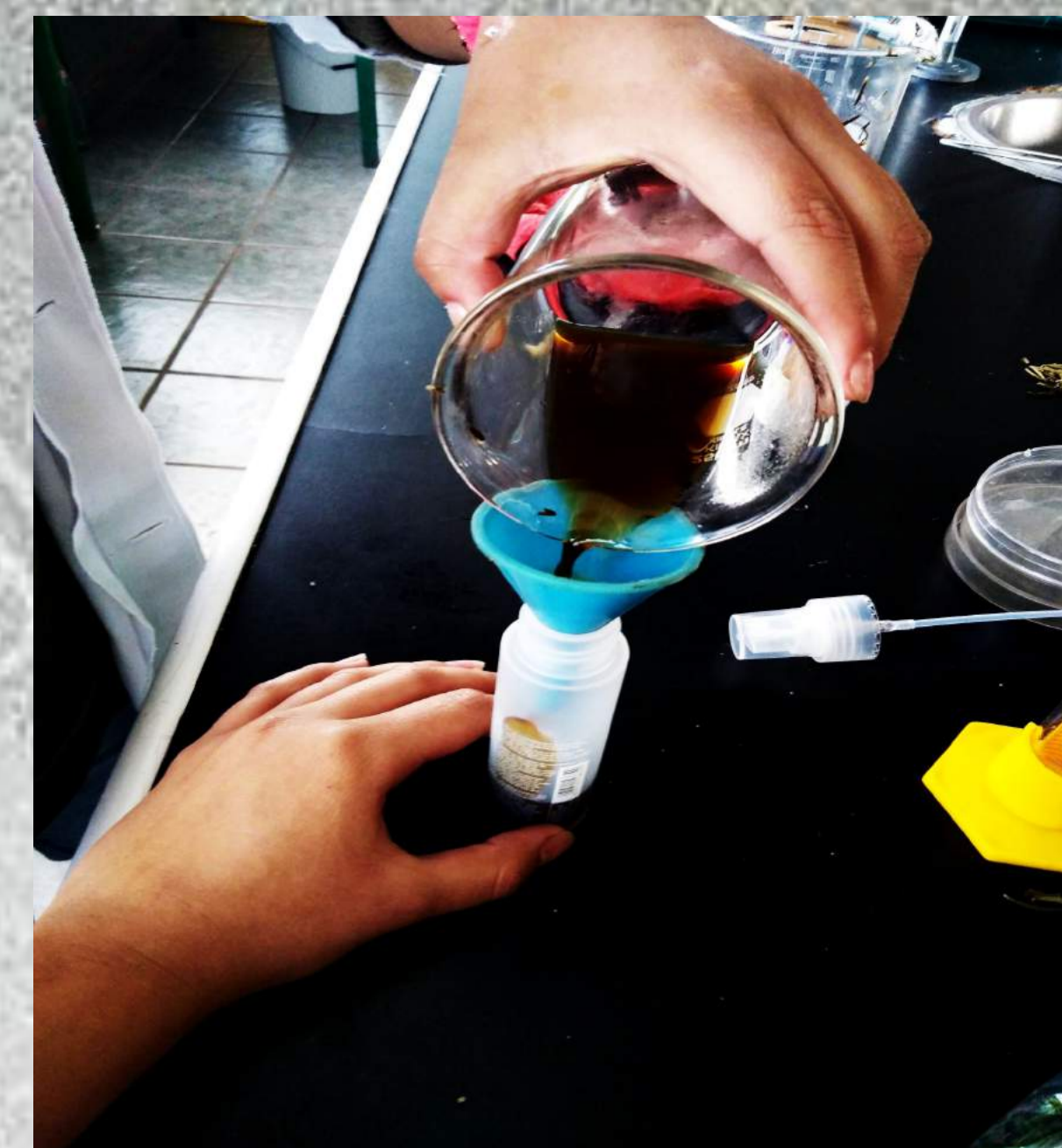
Fig.4: Vertiendo la mezcla