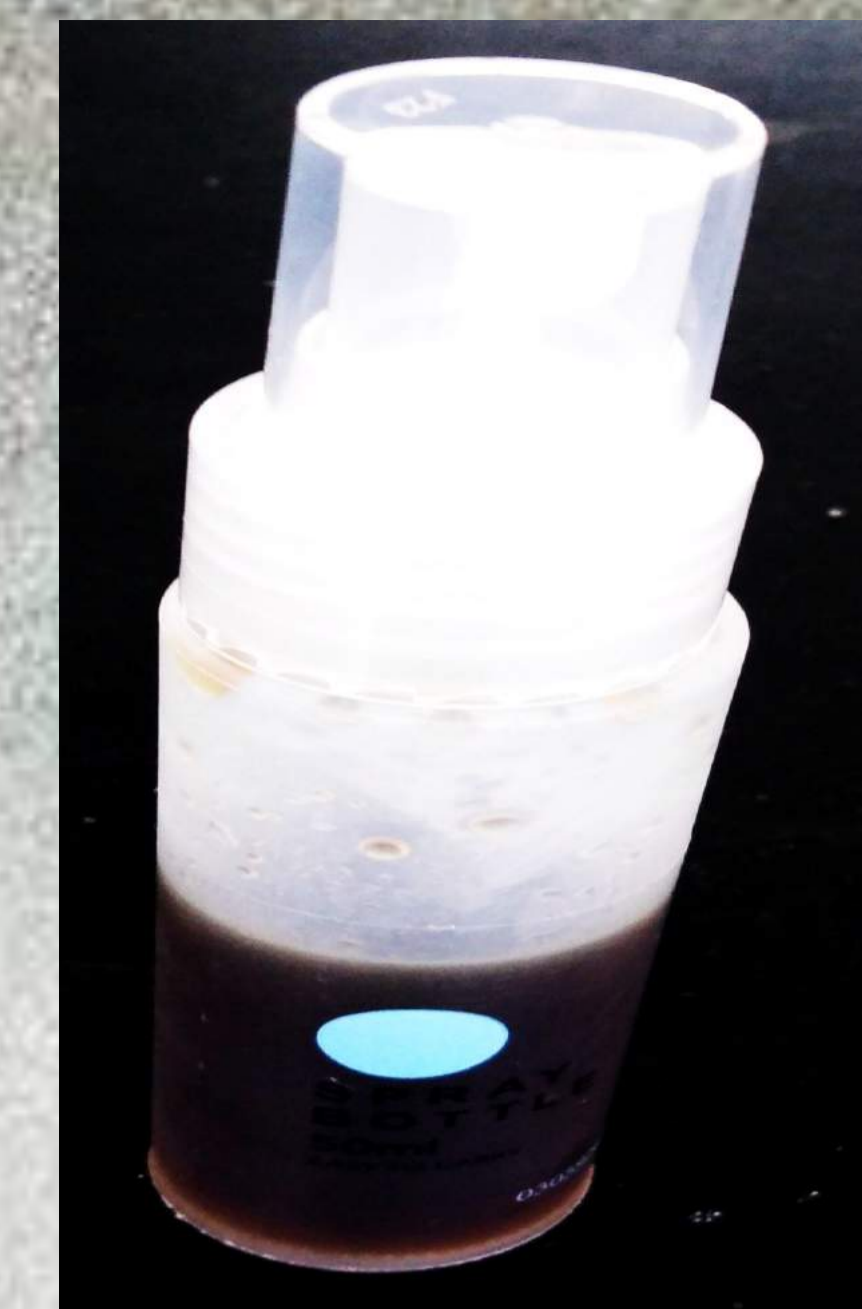
Fig.5: Producto listo